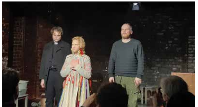
Suomalainen teatteri Pietarissa. Äänettömyys-näytelmä