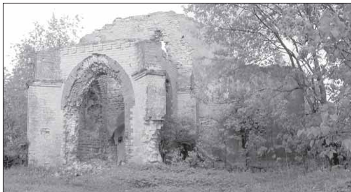
Moloskovitsan kirkon rauniot

dan jälkeen asuimme Volosovassa. Vanhempieni olivat uskovaisia ihmisiä. Olen seurakunnan jäsen seurakunnan perustamisajasta v.1989.